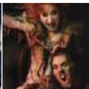
DER TEUFEL MIT DEN DREI GOLDENEN HAAREN