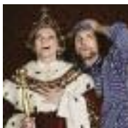
VOM FISCHER UND SEINER FRAU